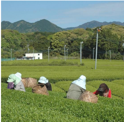
辺法寺町の摘み子さんによる手摘み風景